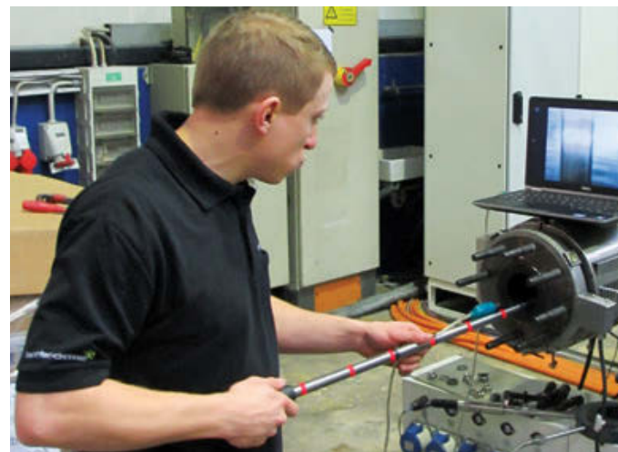
巴顿菲尔辛辛那提专家利用视觉分析技术测量单螺杆机筒