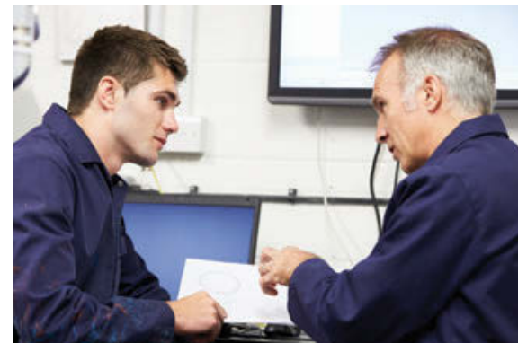
客户工厂培训

根据合约，可以享受到根据您的个性化需求定制的灵活服务。例如，选择合适的维护间隔，或者做挤出生产线的全面维护，提供恰如客户所需的解决方案。