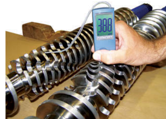
测量锥形双螺杆挤出机螺杆的的镀层厚度