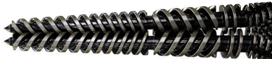
带有“BC涂层”的双螺杆