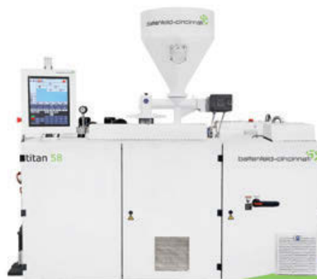
titan系列挤出机经extruserve服务修复后