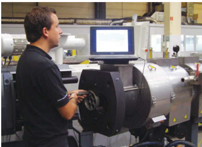
巴顿菲尔辛辛那提磨损技术专家测量锥形双螺杆挤出机机筒