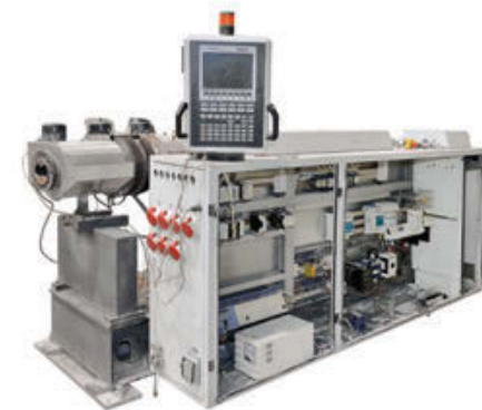
二手挤出机 (titan 系列) 修复前

任何时候, 您都可以通过电子邮件 sales@extruserve.com 联系我们的服务团队。