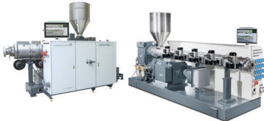
安装了 BCtouch UX 控制系统的双螺杆和单螺杆挤出机